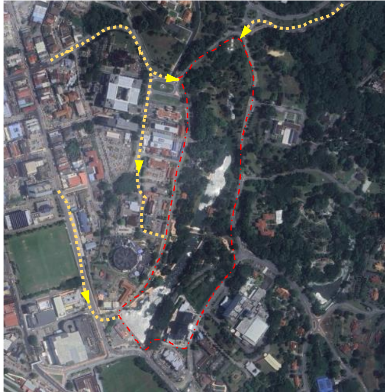
Rajah 04 : Laluan ke tapak cadangan dari Bandar Seremban dengan menggunakan beberapa jalan besar yang menghubungkannya.