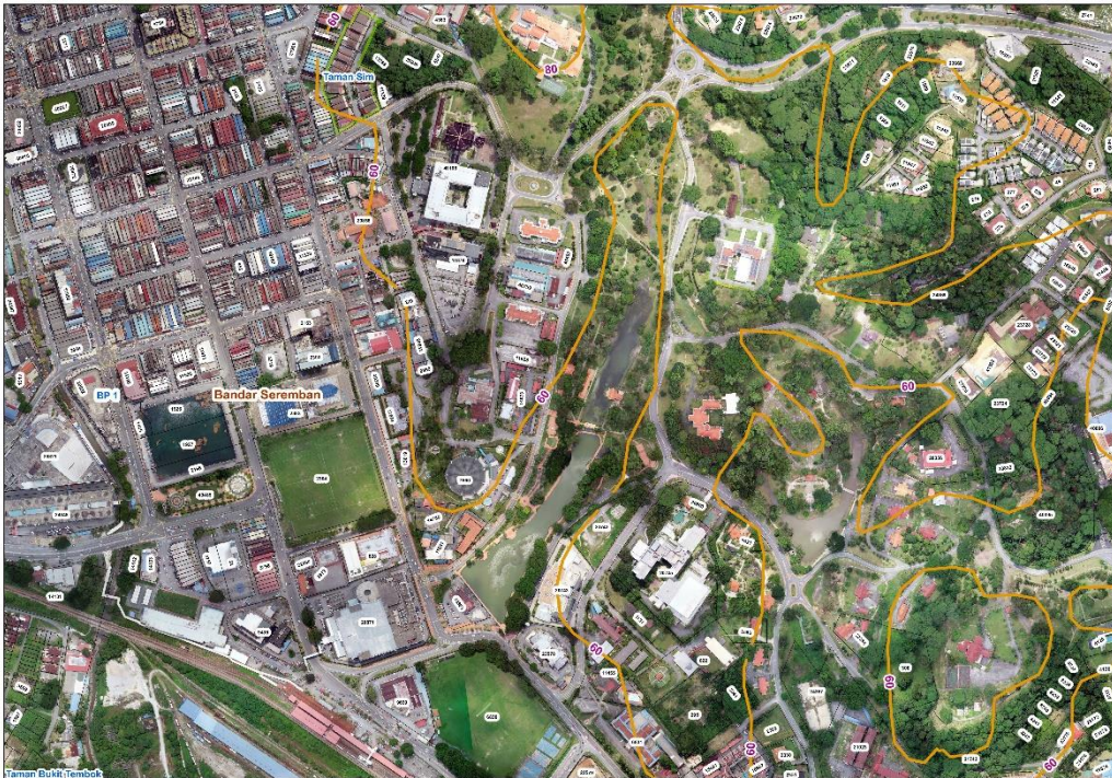
Rajah 07: Topografi tapak cadangan

Taman Tasik Seremban mempunyai bentuk muka bumi yang beralun. Tapak juga terletak dibawah paras jalan di sekeliling tapak. Kawasan di sekitar tasik adalah berbukit, dengan lereng-lereng yang memberikan pemandangan yang cantik ke arah tasik. Terdapat jalan-jalan dan trek yang berliku untuk pengguna berjogging. Pokok-pokok besar di sepanjang laluan pejalan kaki memberi teduhan kepada para pengunjung.