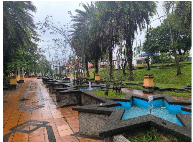
Rajah 06 : Antara pemandangan yang menarik di sekitar tapak cadangan