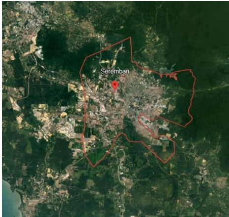
Rajah 01: Pelan Kunci