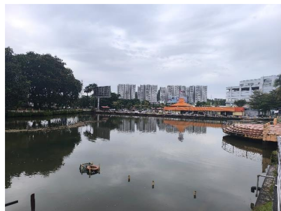
Rajah 05 : Kawasan badan air / tasik yang ada di dalam keadaan tapak cadangan